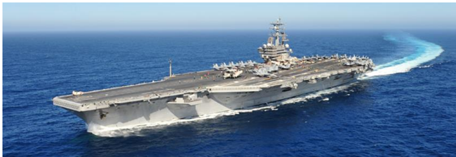
原子力空母ロナルド・レーガン（アメリカ海軍ホームページより）