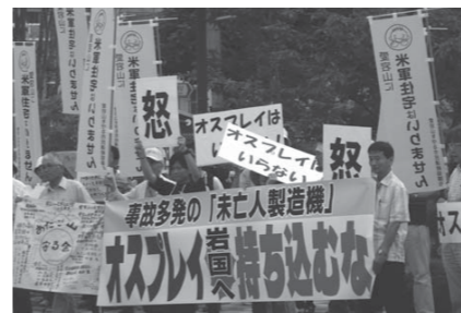
おスプレイ配備に抗議する岩国市民

フィリピン、韓国の平和運動の代表、ASEAN(東南アジア諸国連合)政府関係者も招き、ともに考えます。核兵器や軍事同盟でなく、憲法でこそ平和を実現できる——その展望を示す大会です。