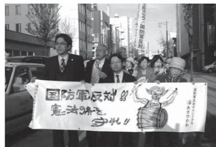
広がる「国防軍」ノー!の運動

安倍政権はこの秋、憲法解釈を勝手に変えて「集団的自衛権行使」を認め、報道・言論の自由を制限する「特定秘密保護法」を制定し、自衛隊を大増強しようとしています。「アメリカとともに戦争する国づくり」の暴走に、広範な人々の反対の声がわきおこっています。この声を全国から集める大会です。