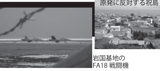
原発に反対する祝島 岩国基地のFA18戦闘機