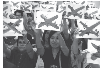
おスプレイノー!高知県民集会

安倍政権は沖縄の県民ぐるみの反対を無視し、米軍の欠陥機おスプレイの配備を強行。名護市辺野古に新基地をつくるため、海の埋め立て許可を知事に迫っています。また、おスプレイは10月に滋賀県・あいば野演習場での日米合同演習や高知県での「防災訓練」に参加。京都・経ヶ岬の自衛隊基地への米軍専用レーダー基地建設反対はじめ、沖縄と全国でわきおこる米軍基地強化反対の運動が大集合する大会です。