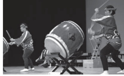
熱気あふれる全体集会