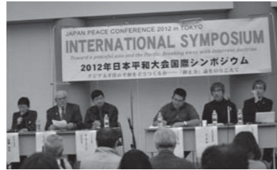
昨年の国際シンポ