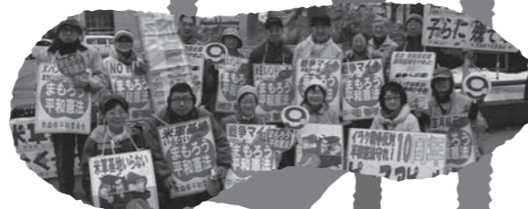
米軍基地強化はノー!と立ちあがった岩国市民