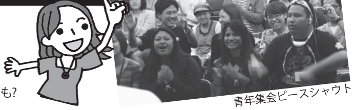
青年集会ピースシャウト

岩国、山口、広島はじめ全国の青年が集合! 本音で米軍基地への思いを語り合い、基地・安保・戦争をなくすにはどうしたらいいのか? みんなで楽しくトーク。大クイズ大会で豪華? プレゼントも?