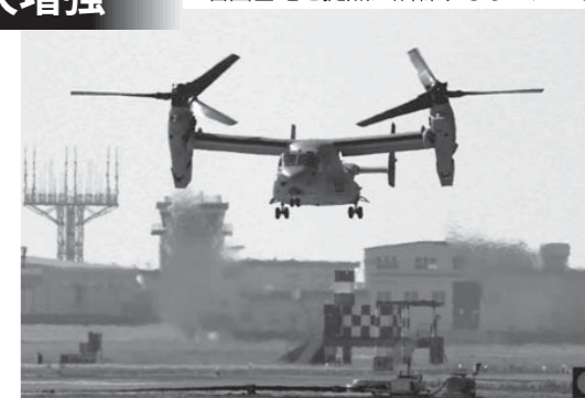
岩国基地を拠点に訓練するおスプレイ

米軍岩国基地は米軍の「殴り込み部隊」海兵隊の航空機部隊の基地。おスプレイの本土での低空飛行訓練の拠点ともなっています。そこに2017年には米原子力空母の艦載機59機が配備され極東最大の航空基地にされる計画で、新たに市の中心部に米軍住宅も建設されようとしています。住民の被害がいつそう深刻になるのは必至。岩国市民は2006年に「住民投票」で艦載機移転反対の意思を示し、基地強化に反対し粘り強く運動をくりひろげています。